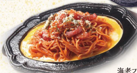
昔ながらの鉄板ナポリタン