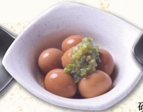
うずら玉子醤油漬け