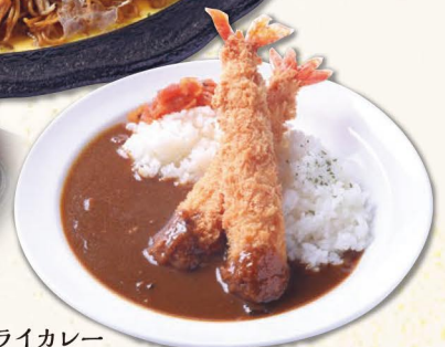
海老フライカレー