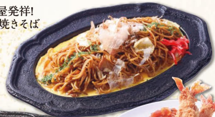
名古屋発祥! 鉄板焼きそば